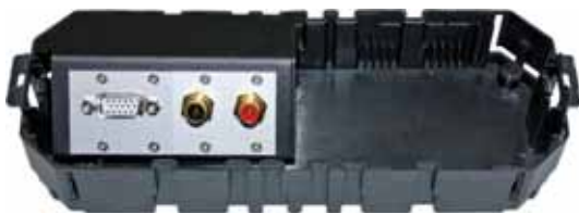
Bild: kundenspezifische Bestückung