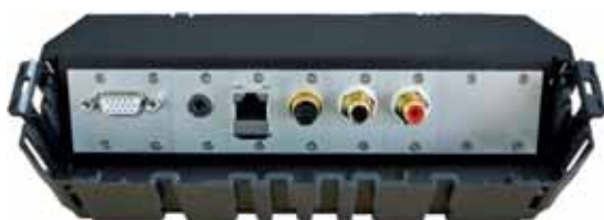
Bild: kundenspezifische Bestückung