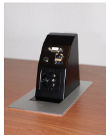
TA Dubay ausgefahren mit Beispielbestückung